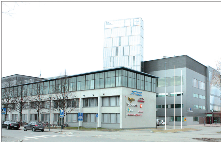
Joensuun Tiedepuistoa on rakennettu vauhdilla, seuraavaksi on tarkoitus rakentaa 4-vaihe.