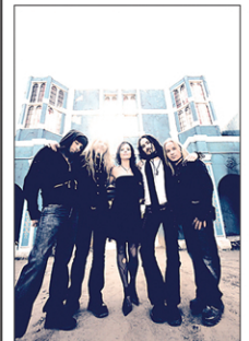
Amerikan kiertueellaan olevan Nightwishin Jukka Nevalainen (vas.) palkittiin yrittäjyydestä.