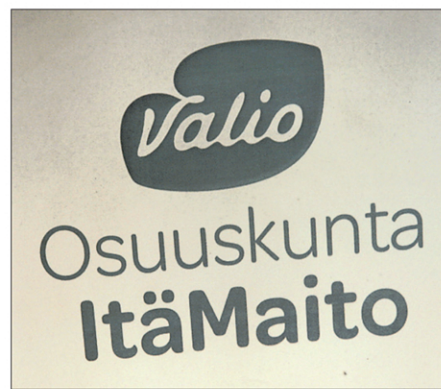
Viime vuonna alkaneet neuvottelut johtivat fuusioon, ja Osuuskunta ItäMaito aloittaa ensi vuoden alussa.