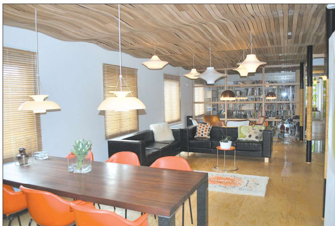
Ruokasalin pöytä on merbauta ja jalat ilomantsilaista mustaa kiveä.