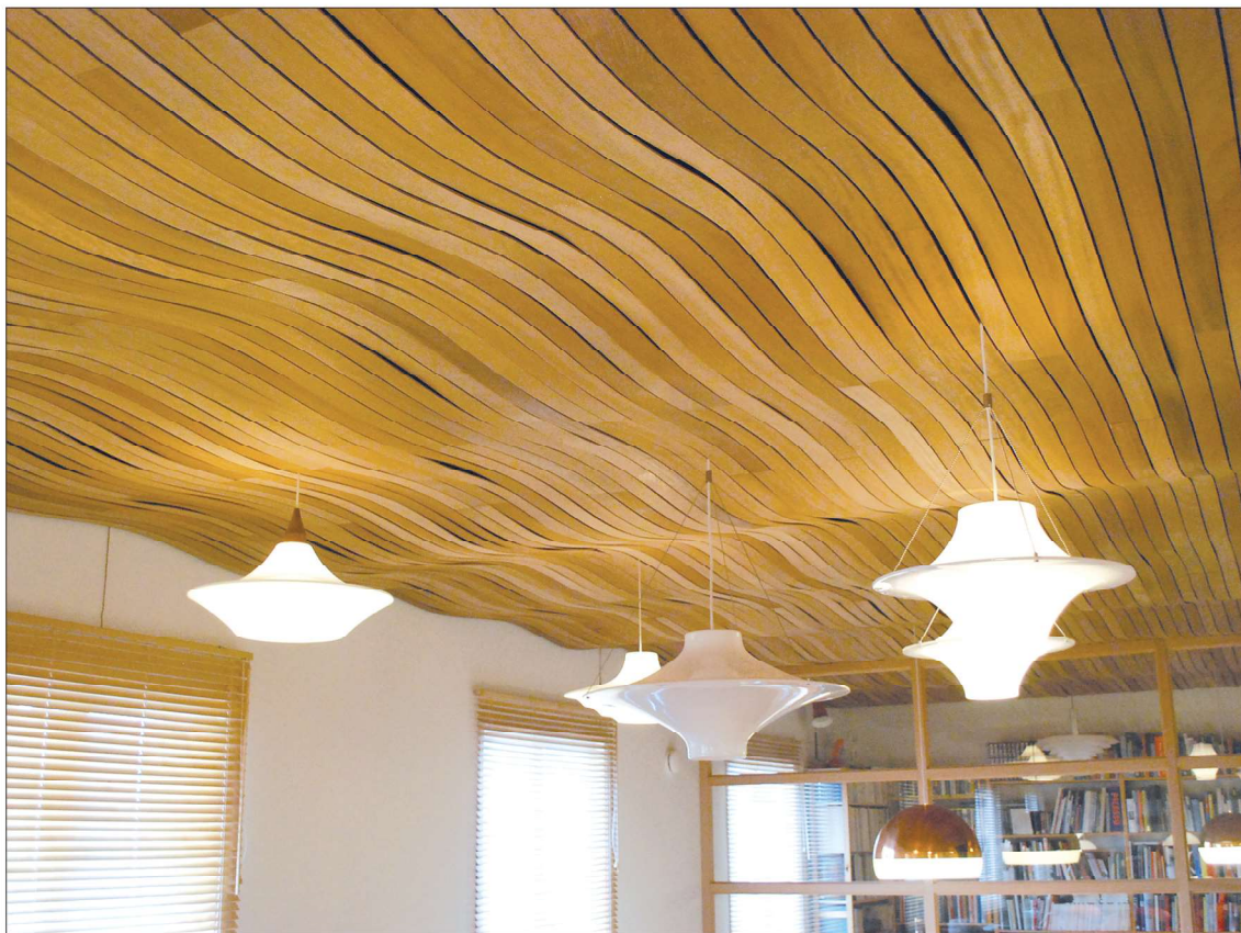
Jalopuusäleistä on toteutettu sisäkatot, joista riippuu yli 30 Yki Nummen suunnittelemaa valaisinta.