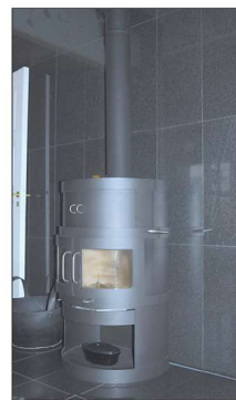
Kaminan takana on käytetty ilomantsin mustaa kiveä.