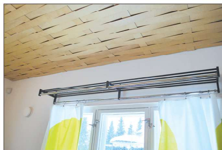
Hattuhylly on saanut uuden elämän verhotankona.