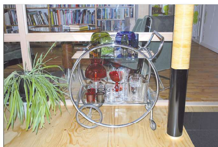
Yrjö Blomstedtin suunnittelemaa tarjoiluvaunua valmistettiin 1940-luvulla.