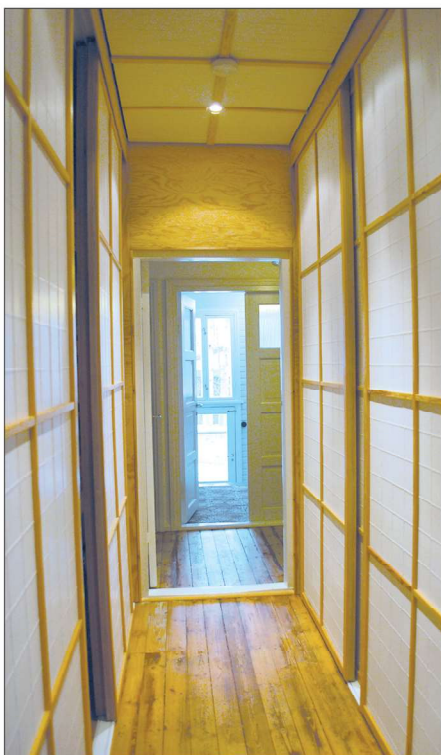
Vaatekomeroiden välisessä käytävässä voi aistia japanilaista henkeä.

- Kukaan ei ole laskenut tarvittua työn määrää. Suunnit-