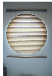
Ikkunoiden sälekaihtimet ovat tilaustyötä.