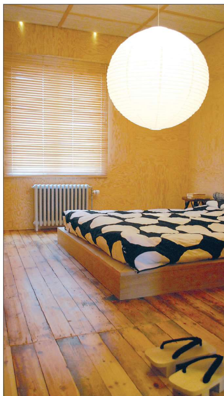
Makuuhuoneessa on alkuperäinen lautalattia.