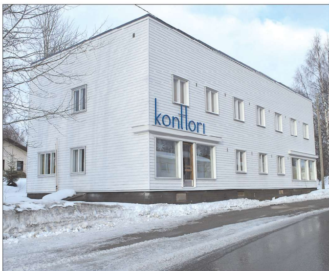
Pääjulkisivuun on palautettu suuret näyteikkunat.

telun olemme tehneet itse ja suunnitelmia pääosin toteutti kaksi taitavaa kirvesmiestä. - A1 koska tämä on valmis, tarkasti ilmaistuna tämä taitaa olla ikuisuusprojekti. Kahvilan lisäksi on suunnitelmisamme ollut rakentaa pihapiiriin vanhan lippakioskin oloinen rakennus, jossa olisi autotalli.