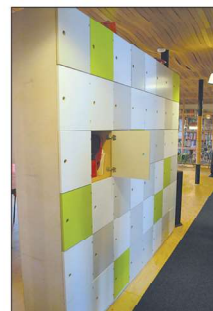
Huonetilaa rajaavan lokerikon ovet ovat kierrätyskeskuksesta.