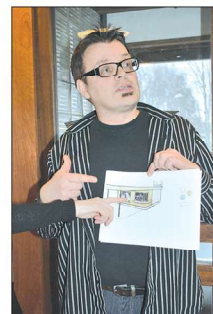
Suunnitelmissa on rakentaa autotalliksi soveltuva lippakioski.

la. Emme halunneet museota emmekä halunneet täydellistä entistämistä, vaan ratkaisuisamme haimme vanhaa henkeä modernilla tavalla.