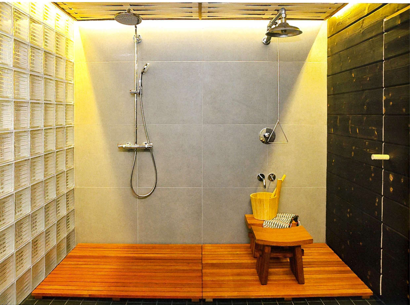
△ Toinen suihkuista on perinteinen kylmä/kuumavesisuihku ja toinen pudottaa niskaan jääkylmän vesiryöpyn.

ja pesuhuonetta erottavan lasitiiliseinän läpi – varsinainen huoneen valaistus on tehty epäsuoraksi ja lempeäksi, säleistä punotun katon reunojen taakse, katseilta näkymättömiin.