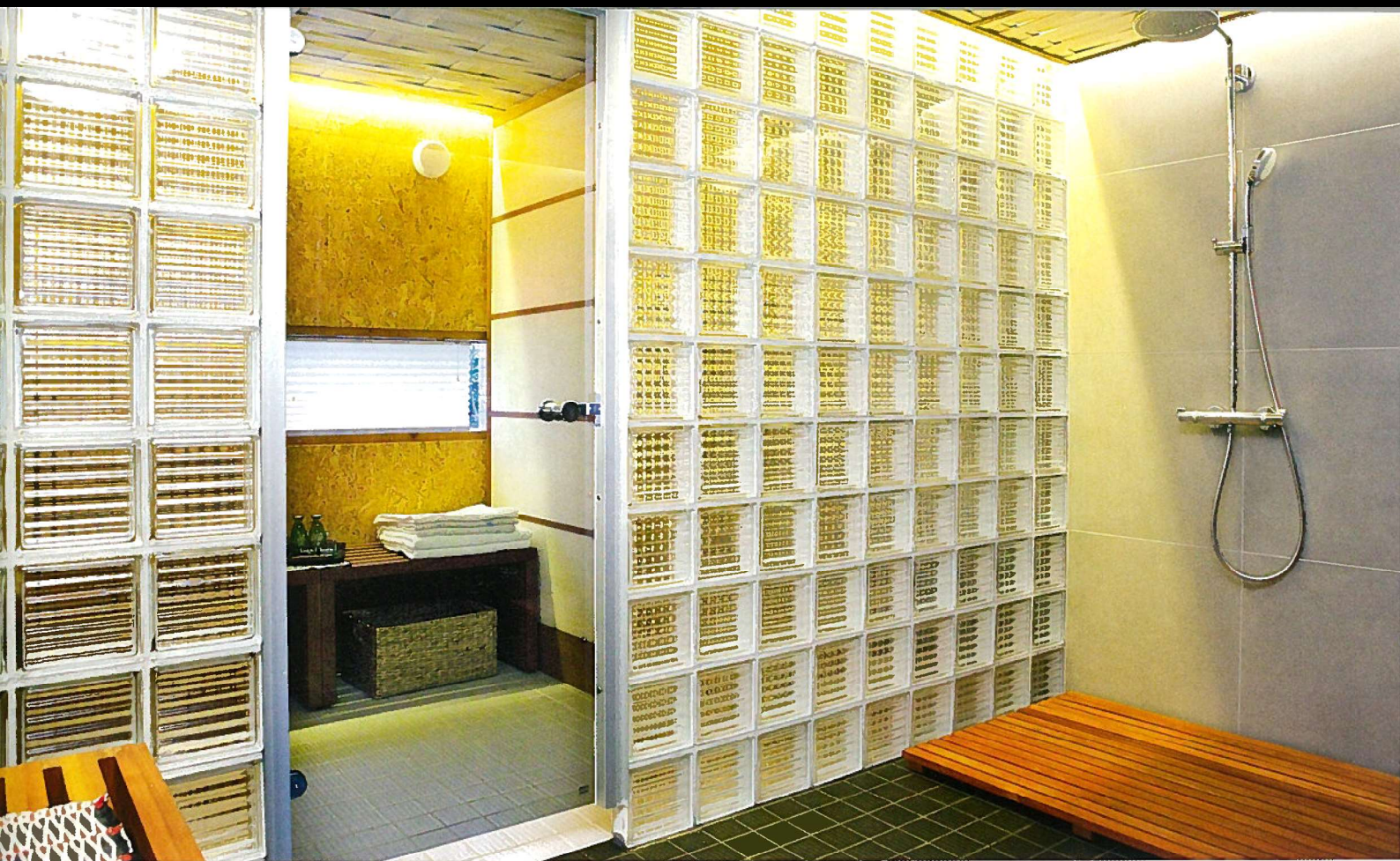
△ Lasitiiliseinä erottaa huoneet toisistaan. Selkeät ruutukuviot sopivat täydellisesti japanilaiseen skandityyliin.