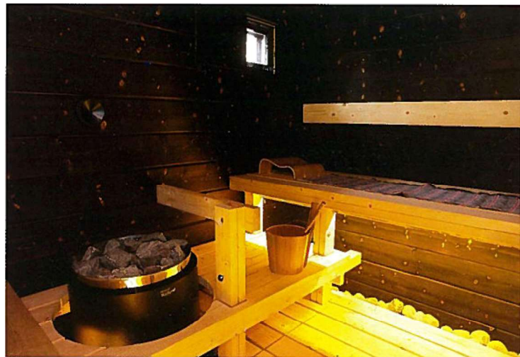
△ Seinät on polttamisen ja pesun jälkeen sivelty parafiiniöljyllä. Myös lauteille tehtiin sama öljykäsittely.

Toinen tärkeä asia Liimatalle on, että rakennusmateriaaleina käytetään