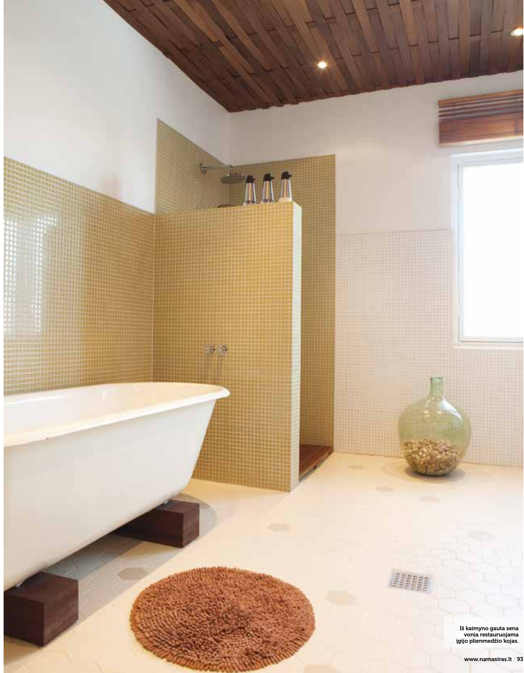
Iš kaimyno gauta sena vonia restauruojama įgijo plienmedžio kojas.