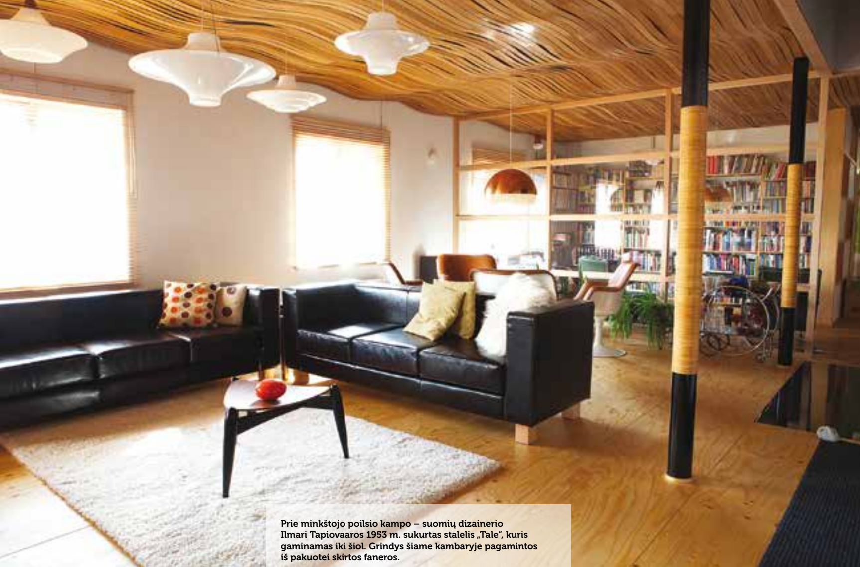
Prie minkštojo poilsio kampo – suomių dizainerio Ilmari Tapiovaaros 1953 m. sukurtas stalielis „Tale“, kuris gaminamas iki šiol. Grindys šiame kambaryje pagamintos iš pakuotei skirtos faneros.