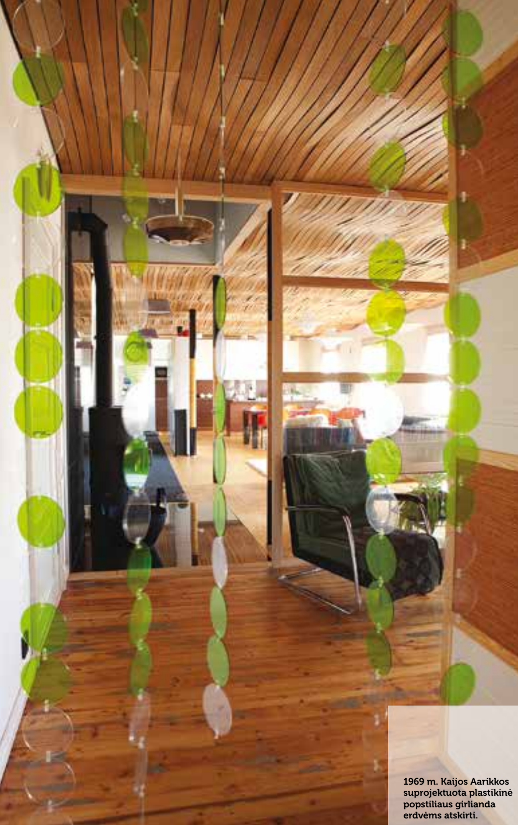
1969 m. Kaijos Aarikkos suprojektuota plastikinė popstiliaus girlianda erdvėms atskirti.