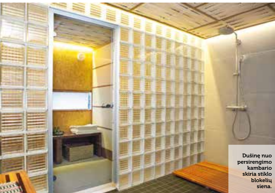
Dušinę nuo persirengimo kambario skiria stiklo blokelių siena.