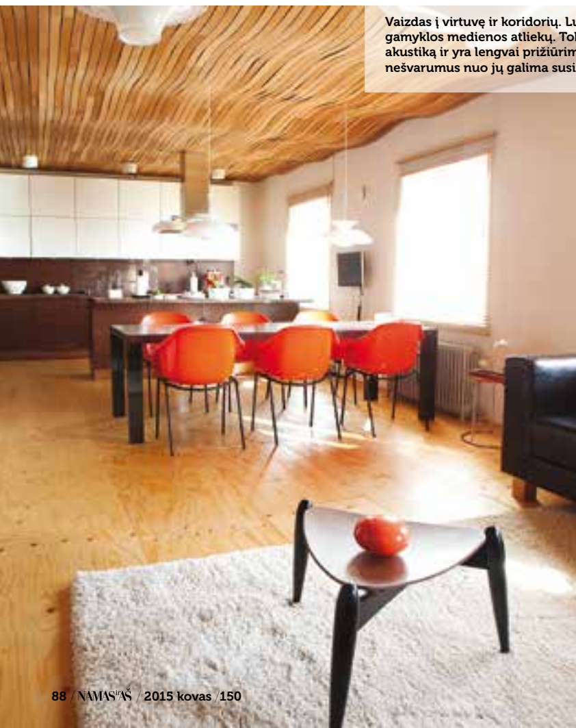
Vaizdas į virtuvę ir koridorių. Lubos pagamintos iš parketo gamyklos medienos atliekų. Tokios lubos sukuria gerą akustiką ir yra lengvai prižiūrimos – po kelerių metų nešvarumus nuo jų galima susiurbti dulkių siurbliu.