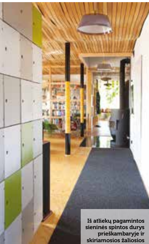
Iš atliekų pagamintos sieninės spintos durys prieškambaryje ir skiriamosios žaliosios citrinų spalvos plastiko girliandos koridoriaus erdvei suteikia gaivaus šviežumo.