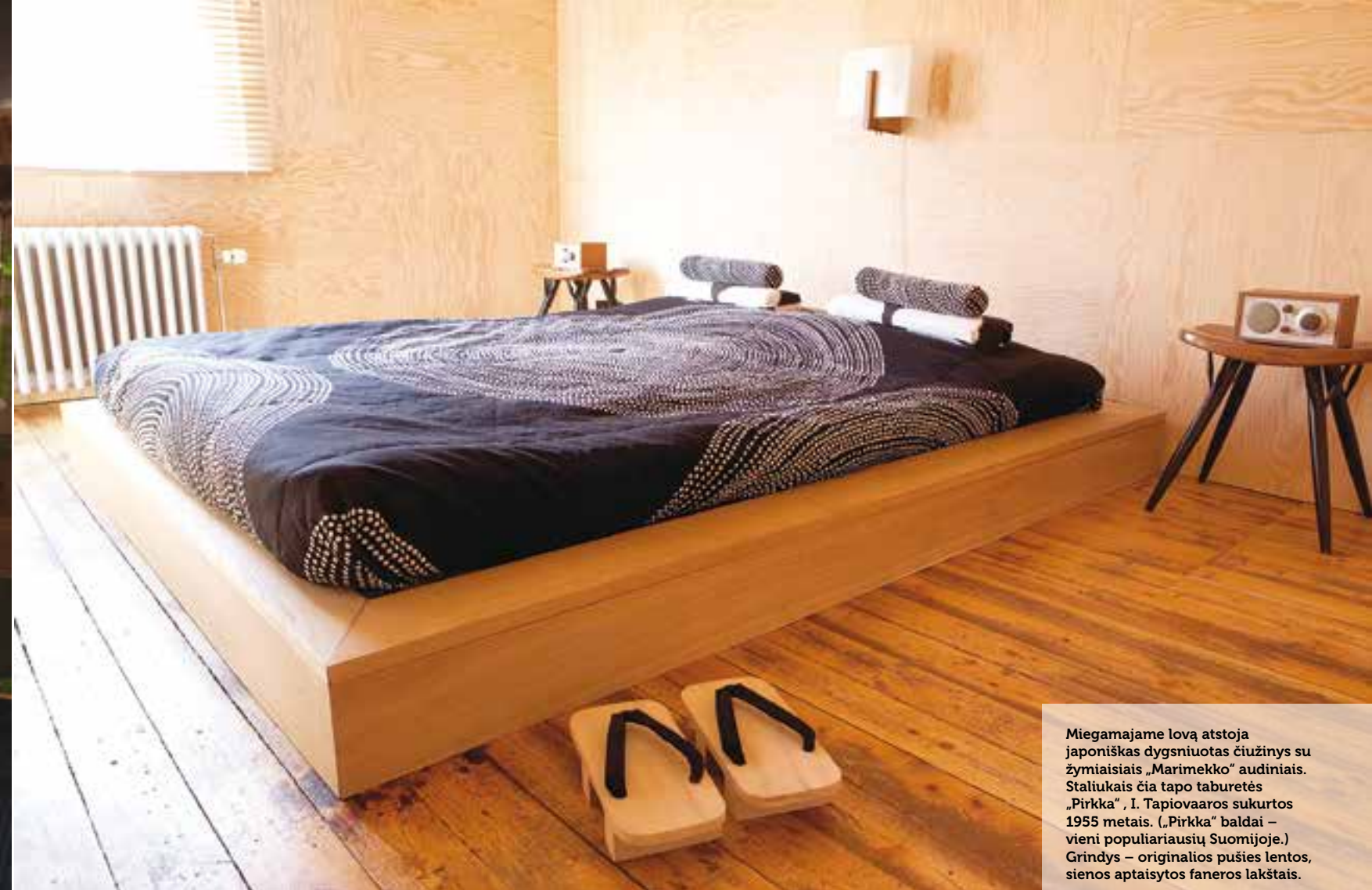
Miegamajame lovą atstoja japoniškas dygsniuotas čiužinys su žymiaisiais „Marimekko“ audiniais. Staliukas čia tapo taburetės „Pirkka“, I. Tapiovaaros sukurtos 1955 metais. („Pirkka“ baldai – vieni populiariausių Suomijoje.) Grindys – originalios pušies lentos, sienos aptaisytos faneros lakštais.